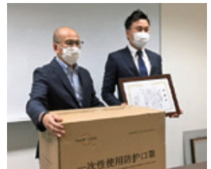
株式会社伊藤建装様からマスクを寄贈いただきました