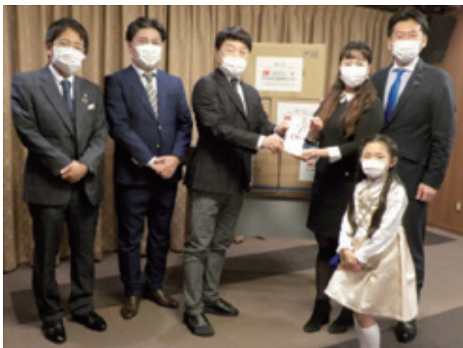
NPO 法人国際技術交流協会様からマスクを寄贈いただきました