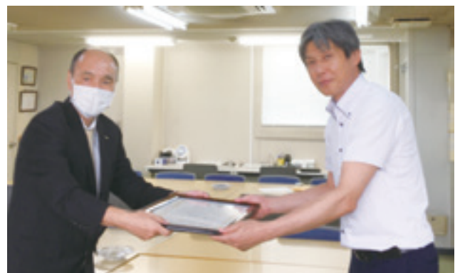
株式会社キョウラク様からマスクを寄贈いただきました。