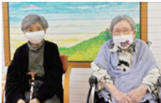
芸舞妓さん手作りのマスクを着用する利用者様