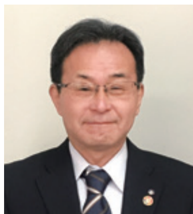
京都市保健福祉局

結びに、貴協議会のますますの御発展、並びに皆様の御健勝、御多幸を心からお祈り申し上げます。