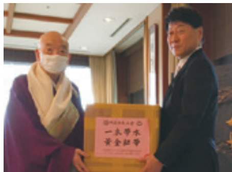
清水寺様が中国仏教協会様からいただいたマスクを寄贈いただきました